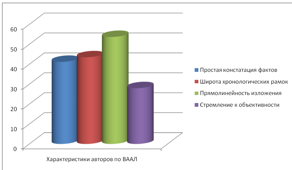
Рис. 1. Психологические характеристики авторов публицистических текстов

Таким образом, проанализировав психологические характеристики агентов современных средств массовой информации, мы имели возможность составления психологического портрета личности их как авторов текстов публицистического характера. Мы выяснили, что современный западный журналист, не руководствуясь специальным политическим заказом, обладает набором характеристик, необходимых большинству современных деятелей СМИ. Анализ таких структурных элементов характера современного журналиста как отношение к труду, отношение к себе, отношение к вещам и к окружающим, характеризует современного деятеля СМИ как стремящегося к объективному изложению социально-ориентированного материала, базирующемуся на фактологических данных. В манере изложения присутствует тяготение к однозначному, хронологически логичному ключу. Касательно же характеристик современного журналиста как агента западных средств массовой информации, то политически обусловленной является тематика публицистических текстов, поскольку обзор событий, связанных с международными отношениями, продиктован современными требованиями социальной стабильности.