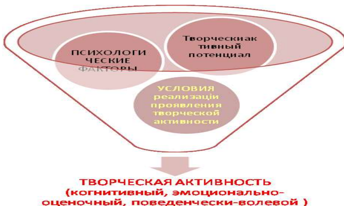
Рис 2. Модель исследования проявления творческой активности людей пожилого возраста

С целью исследования модели проявления творческой активности людей пожилого возраста на основе проведенного анализа [1; 3; 4] научных концепций возрастных изменений личности в старости (В.Фролькис; Н.Александрова; Н.Шахматов; Л.Анциферова; В.Наумова; О.Краснова; А.Лидерс) [1; 4]; основных подходов к исследованию личностного самоопределения (С.Рубинштейн; К.Абульханова-Славская; Л.Анциферова; Н.Пряжников; Н.Александрова; Д.Леонтьев; и др.) [1; 3; 4; 6], теории творческого самовыражения личности (Л.Виготский; Б.Ананьев; А.Копытин; В.Наумова) [1; 4] позволили разработать модель экспериментального исследования проявления творческой активности людей пожилого возраста (рис. 2).