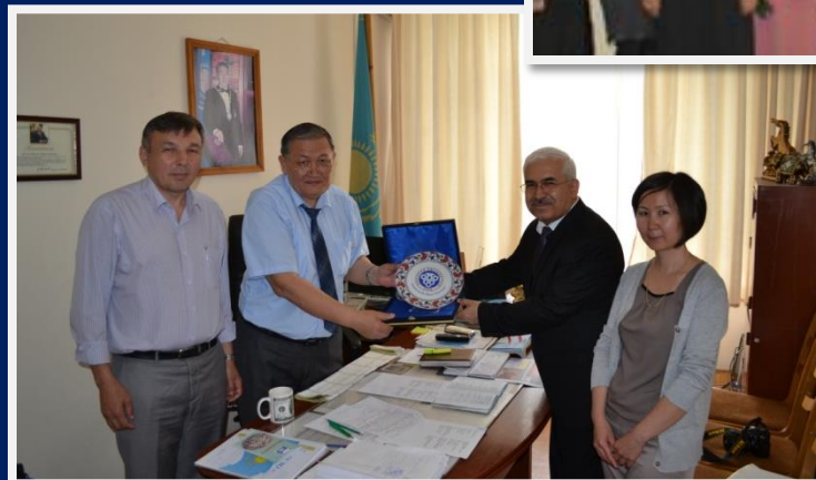
Визит профессоров Эрзинджанского университета, Турция