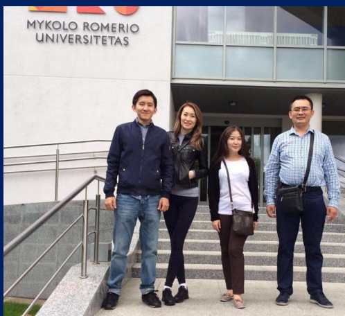
Университет Миколаса Ромериаса (Литва)