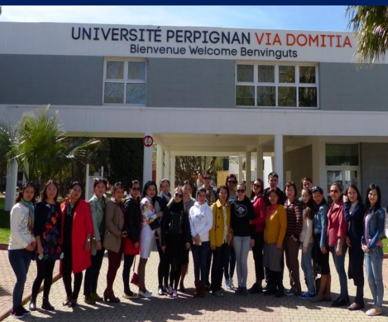
Университет Перпиньян Виа Домиция (Франция)