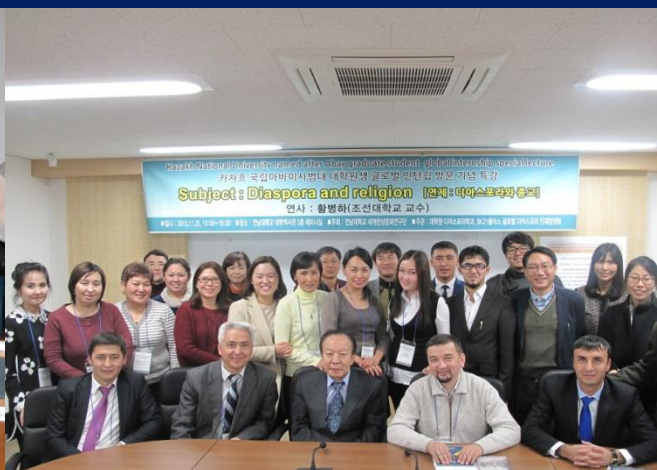
Университет Чоннам (Корея)