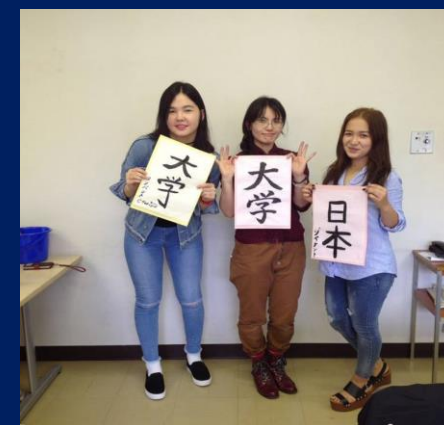
Университет Цукуба (Япония)