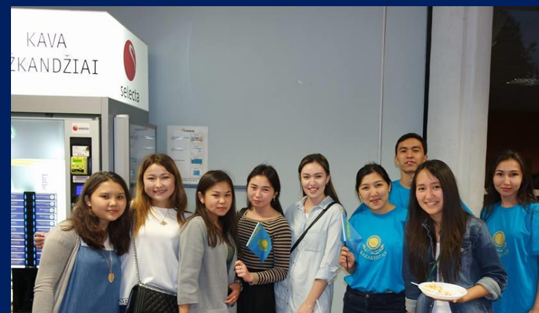
Вильнюсский Университет (Литва)