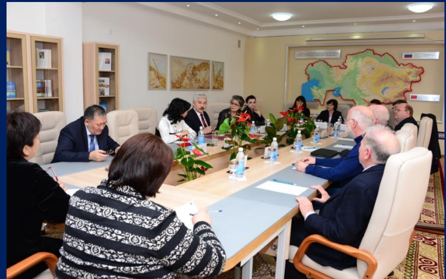
Встреча с коллегами из Германии