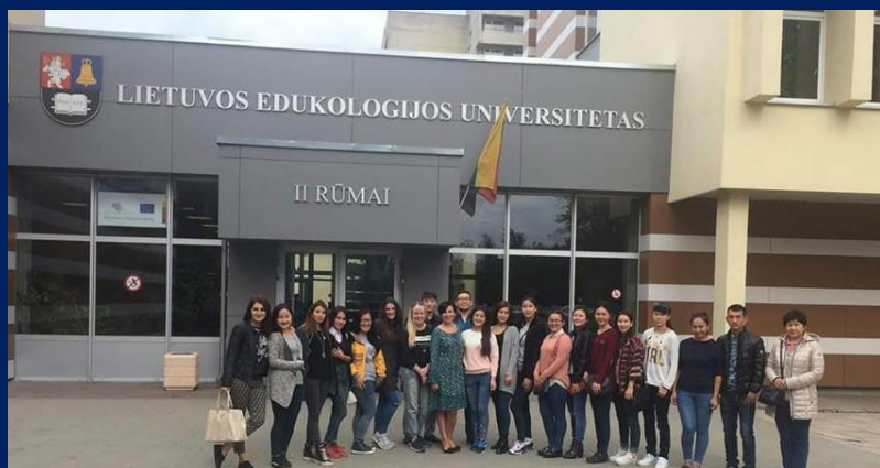
Литовский Эдукологический Университет (Литва)