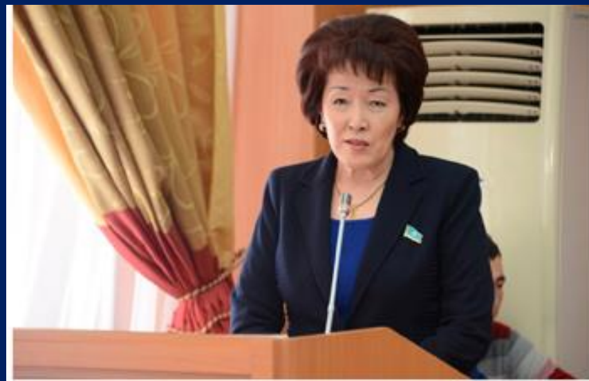
Депутат Мажилиса Парламента РК Г.Исимбаева