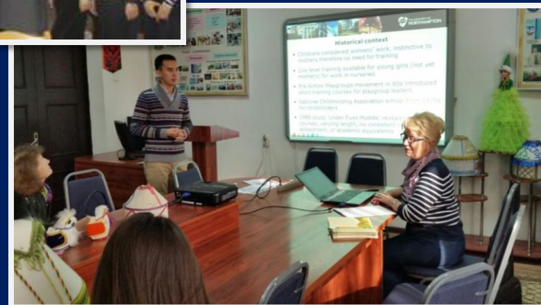
Визит профессоров Университета Нортхэмптона, Англия