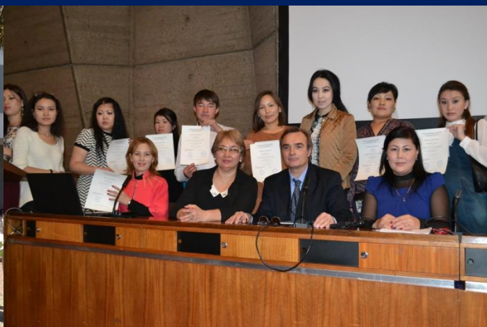
Университет Фиджип-Конкорд (Франция)