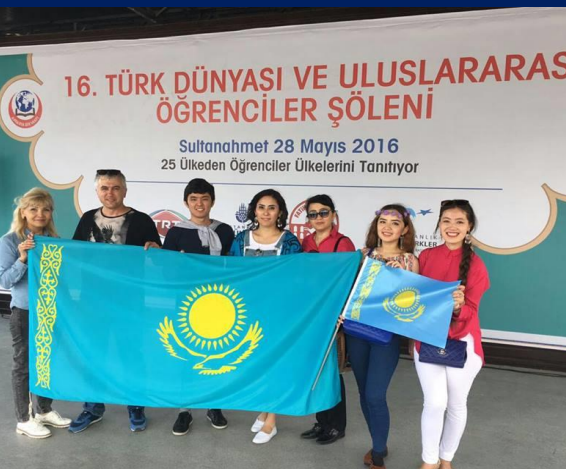
Университет Гази (Турция)