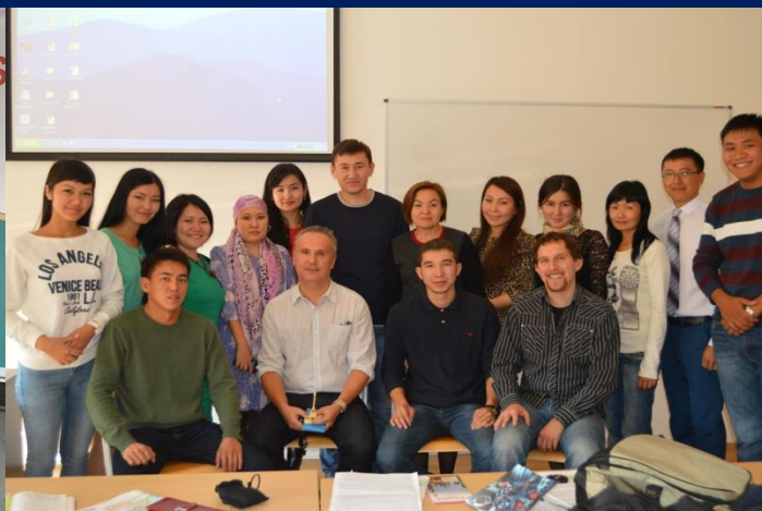
Карлов Университет (Чехия)