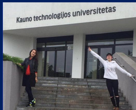
Каунасский Технологический Университет (Литва)