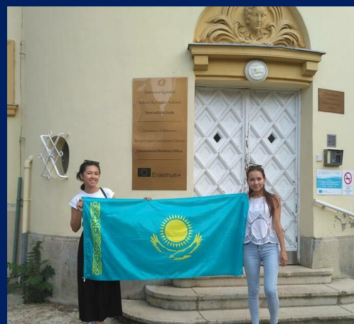
Университет Дебрецена (Венгрия)