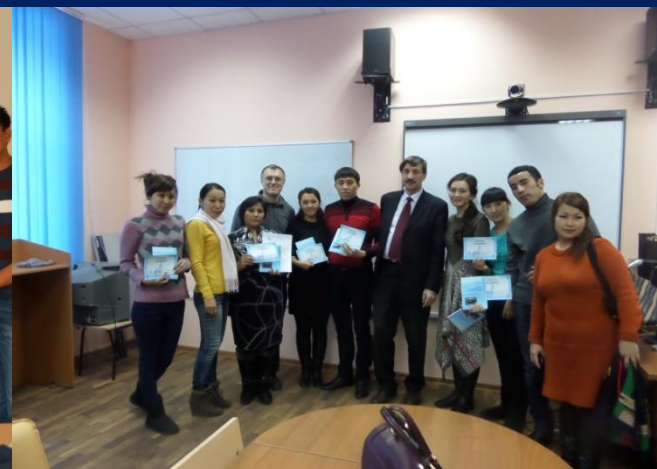
Красноярский ГПУ (Россия)