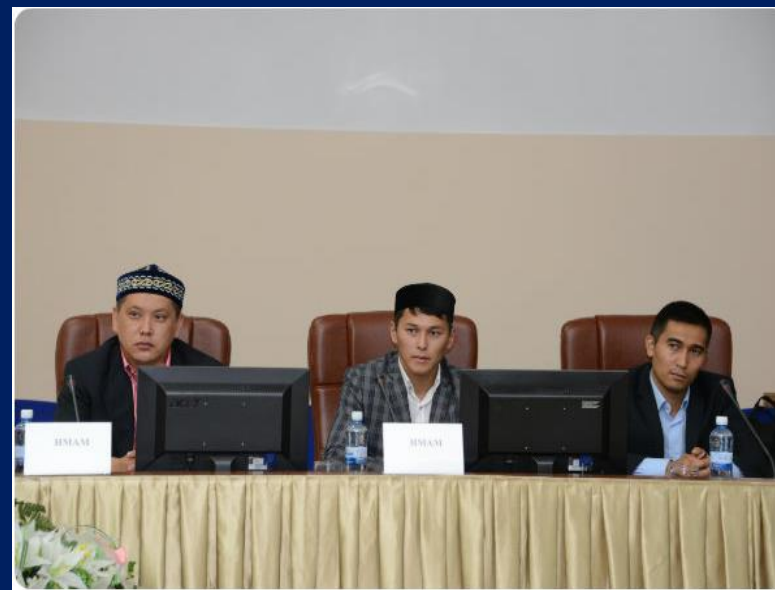
Городской круглый стол «Религиозная неграмотность – путь к религиозному экстремизму»