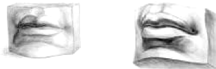
Рисунок 2. Гипсовый слепок губ головы Давида

Трудность в построении рисунка слепка губ головы Давида заключается в том, что форма модели ограничивается исключительно кривыми поверхностями. Плавные очертания контура губ обусловлены всевозможными выпуклостями и вогнутостями окружающих верхнюю и нижнюю губы площадок. Только при соблюдении всех закономерностей рисования возможен положительный результат. В целом рисунок с гипсовой модели ведется так же, как любой тональный, - от общего к деталям и на последнем этапе возвращается снова к общему. Хорошо продуманный, правильно построенный и выдержанный в тоне рисунок передает форму, освещение, материал и окружающую среду.