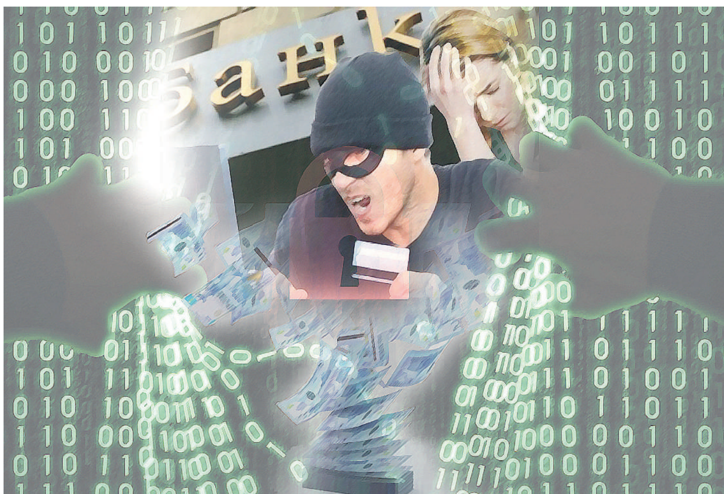
Коллажды жасаған: Журен СМІГІЛ, «ЕО»

И.Екімбаеваның айтуынша, бұдан әрі гипноз жағдайында Евразиялық банктің қосымшасындағы №5269 9400 3010 3404 карта шотына аударылған. Ол бұл шот банк қызметкеріне тиесілі деп түсіндірді. Ертесіне нақ осы банктің