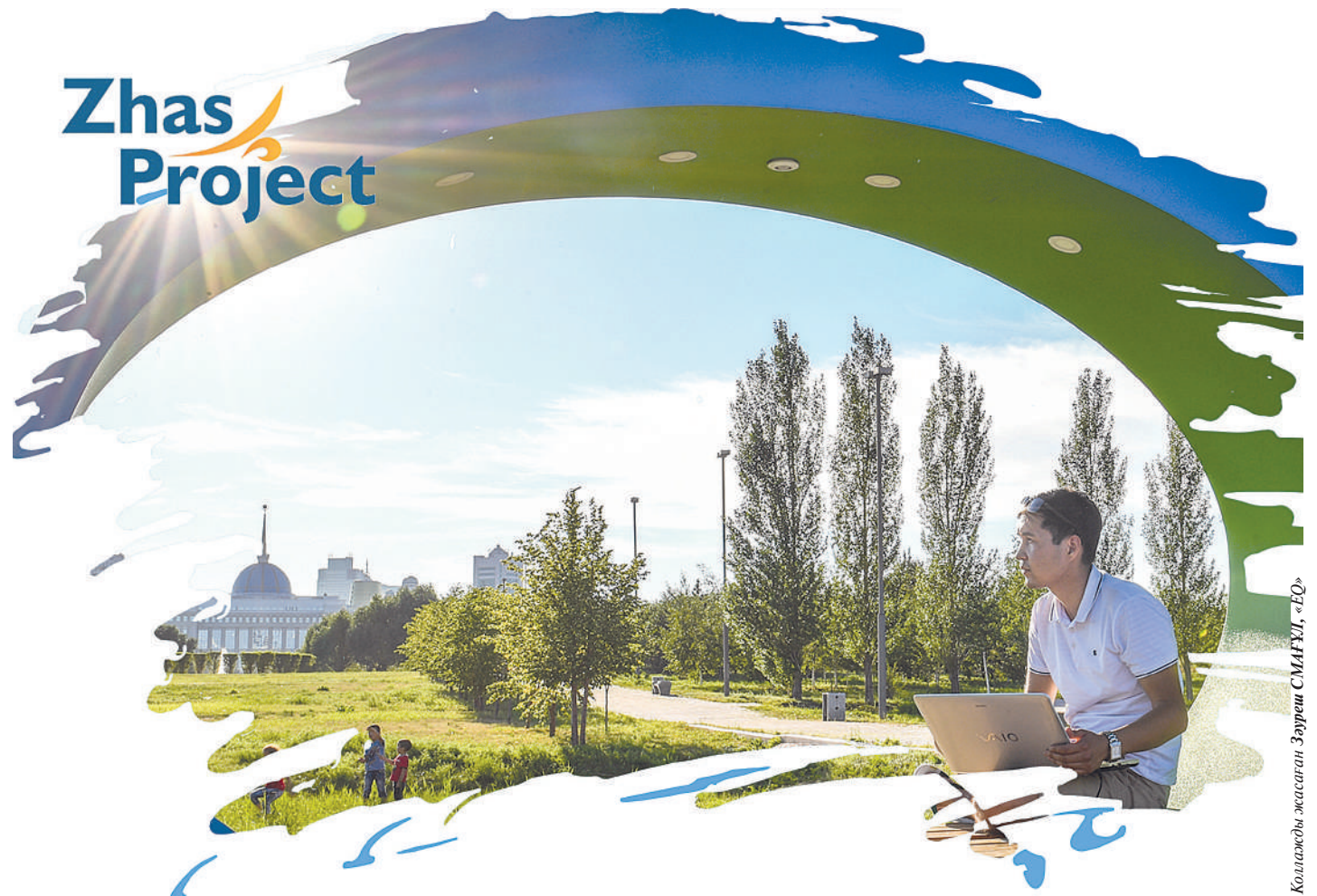
Коллажды жасаған: Әуреш СМАХИТ, «ЕО»

Бұдан бөлек, кәсіппен айналысуға ниет білдірген жастарға кәсіпкерлігін дамыту жөніндегі Еңбек және халықты әлеуметтік қорғау министрлігінің 2021-2025 жылдарға арналған ұлттық жобасы бар. Жоба негізінде азаматтарға жылына 2,5 пайыз жеңілдікпен шағын кредит беру көзделген. Яғни кәсіпкерлікпен айналысқысы келетін немесе кәсіпкерлікпен айналысатын 21 жастан 35 жасқа дейінгі жастар үшін конкурс аясында микрокредит беріледі. Несие беруді «Аграрлық несие корпорациясы» АҚ жүзеге асырады. Номиналды сыйақы мөлшерлемесі жылына 2,5 пайыздан аспайды. Қарыздың ең жоғары сомасы – кепілмен қамтамасыз етудің