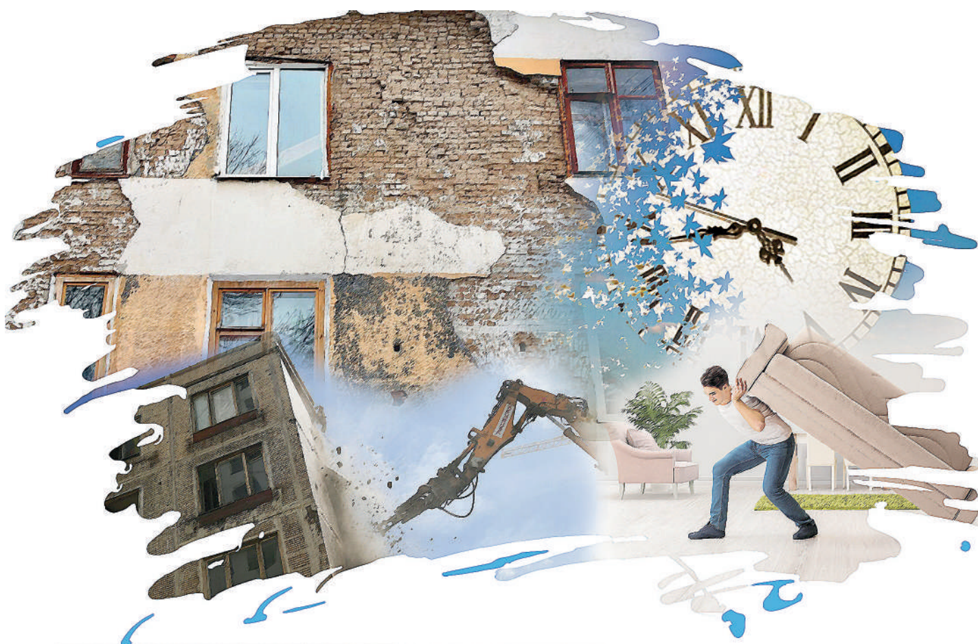
Қаладағы жасалған өзгеріс СМАГУИ, - ЕР