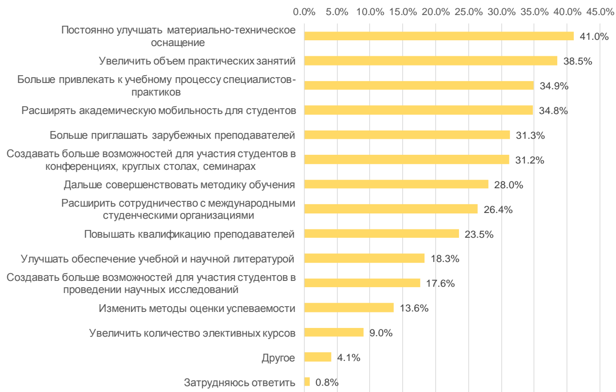
Диаграмма 3. ЧТО БЫ ВЫ ПРЕДЛОЖИЛИ ДЛЯ УСОВЕРШЕНСТВОВАНИЯ ОБРАЗОВАТЕЛЬНОЙ ПРОГРАММЫ ПО СВОЕЙ СПЕЦИАЛЬНОСТИ?, % от общего числа опрошенных, вопрос с возможностью выбрать несколько вариантов ответа

Как видим, самой часто называемой рекомендацией является постоянное улучшение материально-технического оснащения в вузе. Более 40% опрошенных предлагают совершенствовать материальную базу, в особенности, в части обеспечения научно-учебным оборудованием.