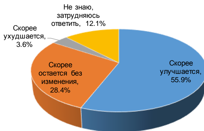
Диаграмма2. КАК ВАМ КАЖЕТСЯ, ЗА ВРЕМЯ ВАШЕГО ОБУЧЕНИЯ КАЧЕСТВО ОБРАЗОВАТЕЛЬНЫХ УСЛУГ В ВУЗЕ УЛУЧШАЕТСЯ, УХУДШАЕТСЯ ИЛИ ОСТАЕТСЯ БЕЗ ИЗМЕНЕНИЯ?, % от общего числа опрошенных

Согласно полученным ответам, среди учащихся ИПиП преобладает позитивная оценка по поводу того, в какую сторону меняется качество образования в вузе: 56% учащихся считает, что оно из года в год продолжает улучшаться. Более четверти опрошенных не видит никаких изменений в отношении качества образования. Лишь 4% респондентов дали негативный ответ, согласившись, что оно только ухудшилось за время их обучения в университете.