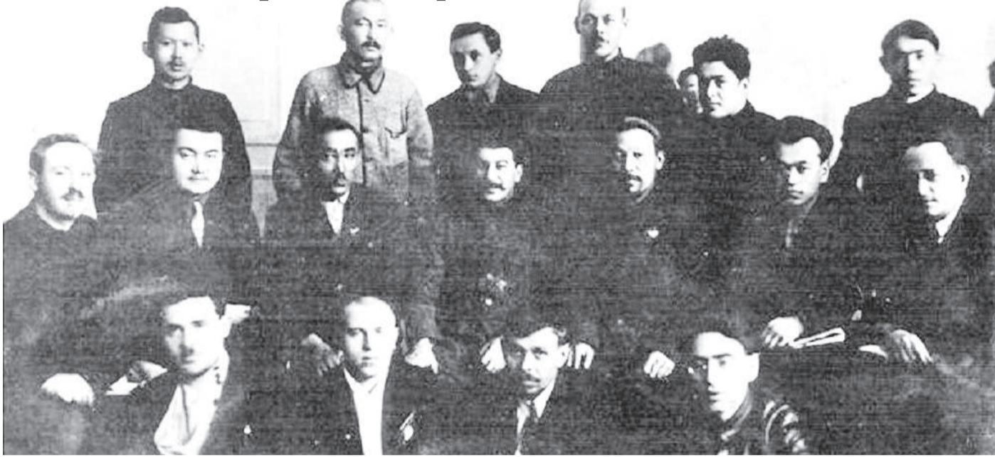
Екінші қатарда сол жақтан 1-ші – Ф. Голощекин, С.Сәдуақасов, Ж.Мыңбаев, И.Сталин, Е.Ерназаров, Н.Нұрмақов

Қазақ Автономиялы кеңестік республикасының құрылғанына 100 жыл толмақ. Ұлттық негіздегі жана мемлекеттің жүйесін қалыптастыру, белгіленген басым бағыттарды ілгері дамыту жолында халқының жанашыры бола білген бірқатар мемлекет басшылары еліне қызмет етуде Алаш қайраткерлерінің ісін жалғастырды. Солардың бірі – 1924-1929 жылдары Қазақстан үкіметінің төрағасы болған Нығмет НҰРМАҚОВ еді.