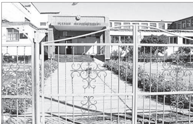
Шығыс Қазақстан облысы Үржар ауданы Мақаншы ауылы, Найманбай атындағы орта мектеп