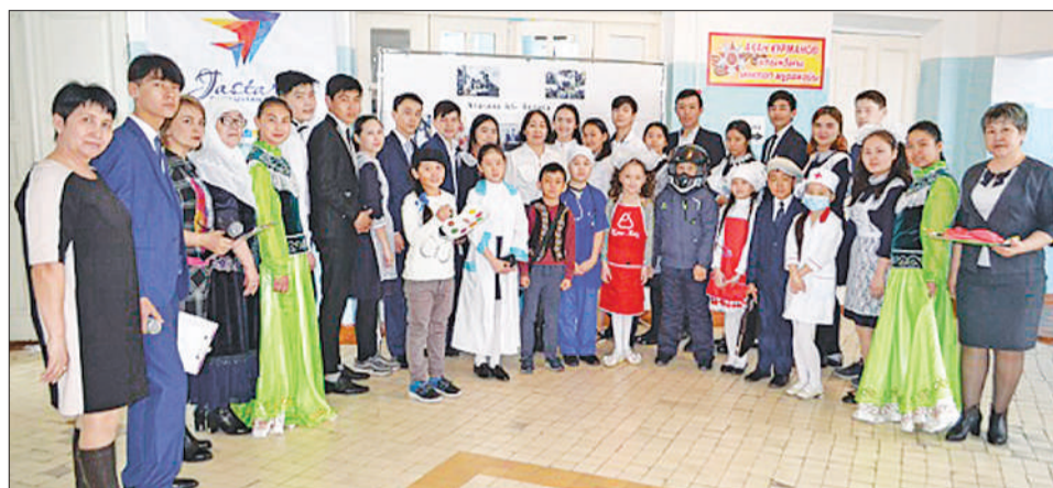
КГУ «СШ №8» г. Атбасара